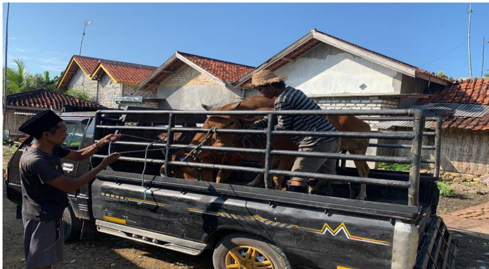
Gambar 6. Penanganan Lalulintas Ternak Antar Wilayah

Kebijakan umum yang diterapkan saat terjadi wabah adalah dengan menghentikan sementara lalu lintas hewan hidup (keluar dan masuk daerah wabah) dan pengendalian ketat produk hewan (berbasis risiko). Tujuannya adalah agar virus tidak menyebar ke daerah lain melalui lalu lintas ternak dan produk hewan yang berisiko tinggi. Selain itu, dengan cara mengisolasi hewan yang terinfeksi dan diberikan terapi suportif, vaksinasi dan peningkatan biosecurity . Biosekuriti ini mencakup biosekuriti barang, kandang, karyawan peternakan, tamu kunjungan, kendaraan, dan ternak. Hewan ternak yang berasal dari daerah wabah dan daerah terancam, wajib dipisahkan dan ditempatkan di kandang isolasi, meskipun tampak sehat.