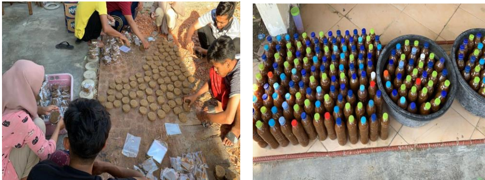
Gambar 4. Pembuatan UMB dan Herbal Booster PMK

Pengendalian penyakit sapi yang paling baik adalah menjaga kesehatan sapi dengan tindakan pencegahan guna mencegah timbulnya penyakit yang dapat mengakibatkan kerugian. Tindakan pencegahan untuk menjaga kesehatan sapi adalah: 1). Menjaga kebersihan kandang beserta peralatannya, termasuk memandikan sapi. 2). Sapi yang sakit dipisahkan dengan sapi sehat dan segera dilakukan pengobatan. 3). Mengusahakan lantai kandang selalu kering (Susilawati dan Masito, 2010).