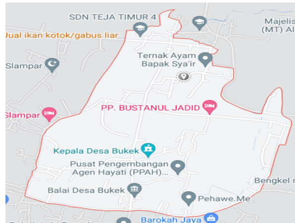
Gambar 2. Peta Desa Bukek Tlanakan Pamekasan