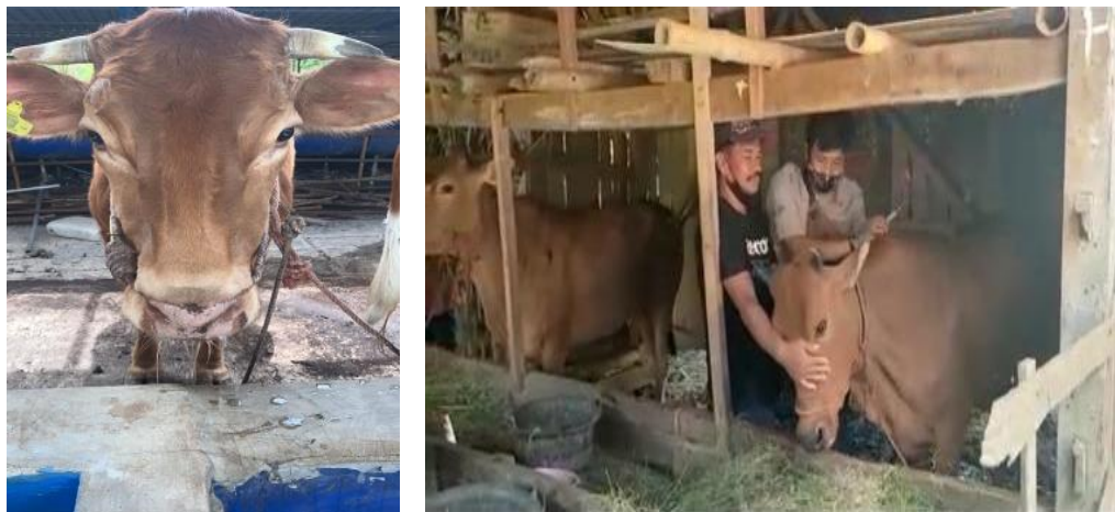
Gambar 5. Pemberian Vitamin dan Vaksinasi Ternak

Kebijakan umum yang diterapkan saat terjadi wabah adalah dengan menghentikan sementara lalu lintas hewan hidup (keluar dan masuk daerah wabah) dan pengendalian ketat produk hewan (berbasis risiko). Tujuannya adalah agar virus tidak menyebar ke daerah lain melalui lalu lintas ternak dan produk hewan yang berisiko tinggi. Selain itu, dengan cara mengisolasi hewan yang terinfeksi dan diberikan terapi suportif, vaksinasi dan peningkatan biosecurity . Biosekuriti ini mencakup biosekuriti barang, kandang, karyawan peternakan, tamu kunjungan, kendaraan, dan ternak. Hewan ternak yang berasal dari daerah wabah dan daerah terancam, wajib dipisahkan dan ditempatkan di kandang isolasi, meskipun tampak sehat.