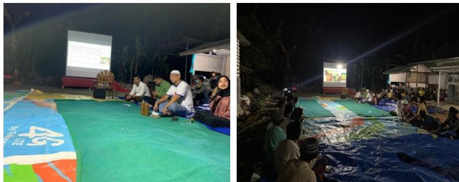
Gambar 3. Edukasi Pembibitan dan PMK di Desa Bukek

Penjelasan pada gejala klinis PMK kepada peternak di desa Bukek antara lain dengan pengecekan demam tinggi pada sapi bisa mencapai 41° C dan menggigil, tidak nafsu makan (anorexia), penurunan produksi susu drastis pada sapi, kehilangan bobot badan, kehilangan kontrol panas tubuh, myocarditis dan abortus pada hewan muda, pembengkakan limfoglandula mandibularis, hipersalivasi (air liur berlebihan), serta adanya lepuh dan erosi di sekitar mulut, moncong, hidung, lidah, gusi, kulit sekitar kuku, dan puting ambing. Langkah ini diberikan sebagai gambaran pada peternak untuk memberi edukasi sejak dini pada pengenalan klinis pada sapi yang terkena PMK.