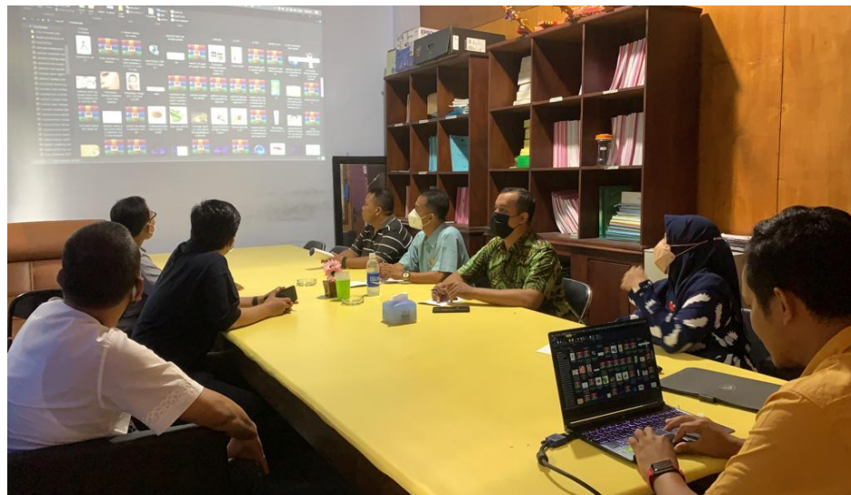
Gambar 7. FGD dan Musdes Desa Bukek

Permasalahan yang terjadi ini sangat diperlukan pihak dan instansi terkait dalam menangani wabah tersebut. Pengendalian PMK sebelumnya dilakukan dengan pengetahuan peternak yang terbatas sehingga dirasa kurang maksimal. Salah satu upaya yang dilakukan pihak desa yaitu penyuluhan, pemberian vaksin PMK kepada sapi para peternak. Pemberian vaksin dilakukan setelah kondisi vaksin membaik hal ini dapat dilihat dari nafsu makan sapi yang meningkat.