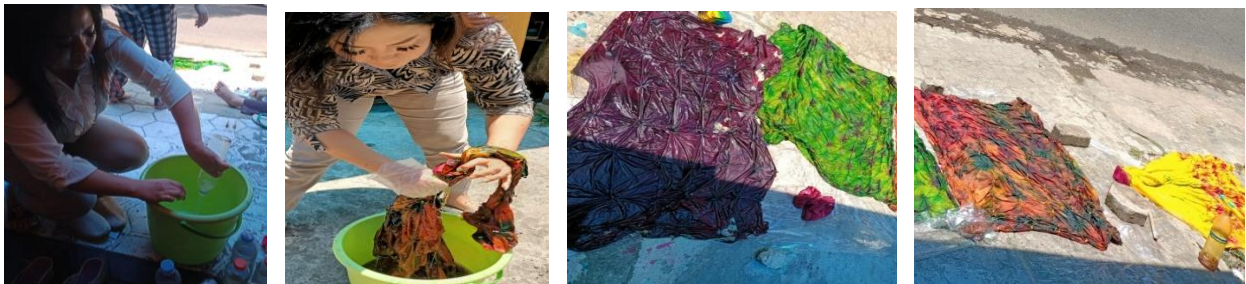
Gambar 9. Proses Pengikat Warna

Pada proses pewarnaan kedua ini digunakan untuk mewarnai kain yang dilipat;-ipat. Prosesnya adalah dengan mencelupkan bagian dari lipatan kain dengan warna yang diinginkan, untuk dapat mendapatkan corak warna yang berwarna warni maka pemberian warna pada satu sisi berbeda pada sisi lainnya. Sehingga hasilnya akan tampak pada corak warna yang bercampur antara satu dengan lainnya. Kemudian kain yang sudah diwarnai dijemur kembali agar kering.