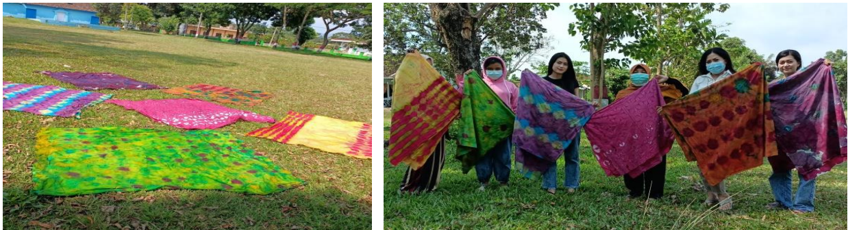
Gambar 11. Kain Jumputan Yang Sudah Kering

Setelah tahapan tersebut diatas, kain yang sudah kering dapat dijual atau diproduksi menjadi baju jadi yang indah, seperti dibawah ini.