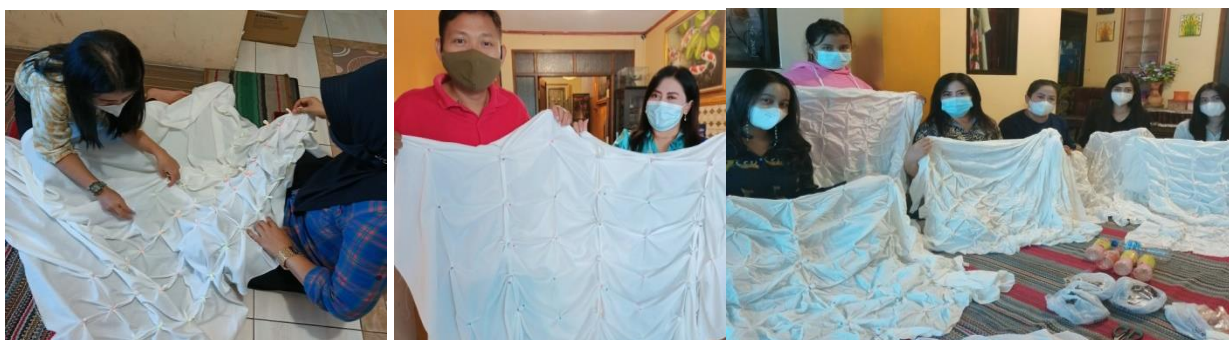
Gambar 4. Cara Menjumput Kain Yang Telah Memiliki Pola

Gambar 3 diatas adalah pembuatan pola dengan menggunakan cara melipat berulang kali kain putih yang akan diberi corak jumputan. Cara pelipatannya yaitu bahwa kain yang lebarnya sebesar 2 m tersebut dibentangkan kemudian dilipat bolak balik dengan lebar sekitar 10 cm. Selanjutnya kain yang dilipat tersebut di lipat menjadi bentuk segitiga dan berlanjut sampai dengan kain tersebut habis. Setelah jadi menjadi tumpukan kain yang telah dilipat untuk memperkuat lipatannya terhadap kain tersebut di ikat oleh karet, dan kain yang telah dilipat siap untuk diberi warna.