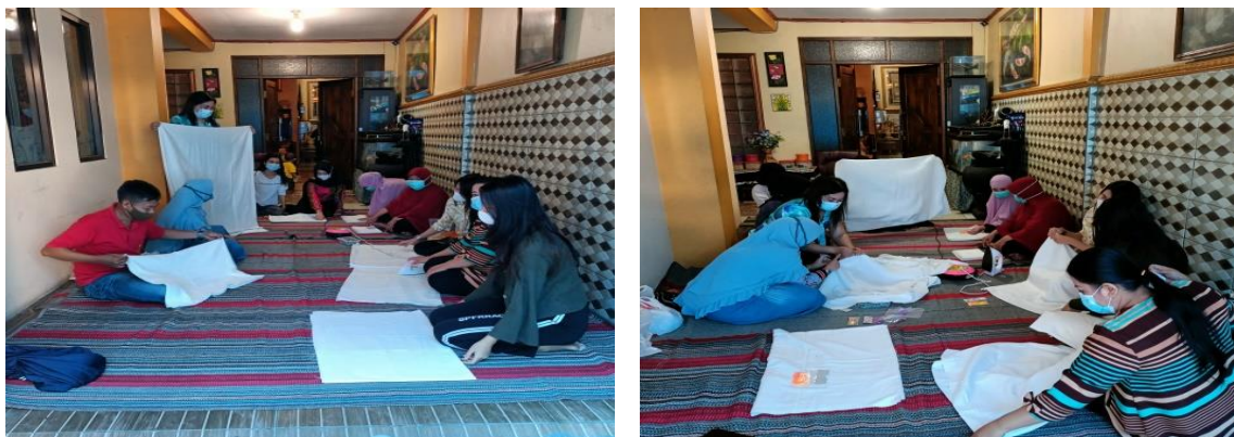
Gambar 2. Membuat Pola Untuk Jumputan

Tim pengabdian memberikan contoh kepada peserta pelatihan tentang bagaimana cara membuat motif di kain putih sesuai dengan keinginan dari peserta sebagaimana yang telah diberikan pada pelatihan materi, ada yang dengan cara dijumput dan diikat menggunakan karet dengan pola yang telah mereka buat, ada juga yang langsung dilipat-lipat dengan menggunakan karet dan benang, sehingga motif yang dihasilkan berbeda-beda sesuai dengan ikatan dan juga modifikasi lipatan yang dibuat pada saat pewarnaan.