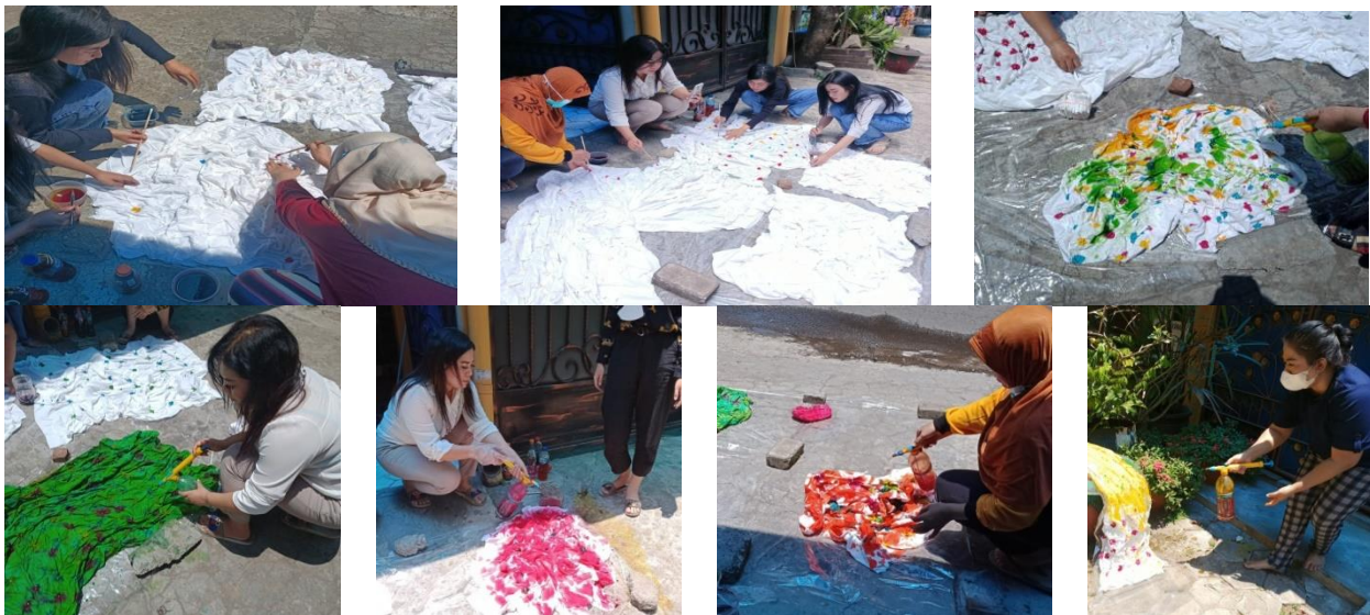
Gambar 7. Proses Pewarnaan 1

Proses selanjutnya adalah mempersiapkan tempat yang akan digunakan untuk proses pewarnaan, yaitu mengalasi lantai dengan plastik, kemudian kain putih yang sudah diberi pola dengan ikatan diletakkan diatas plastik yang sudah disiapkan, dipersiapkan untuk diwarnai.