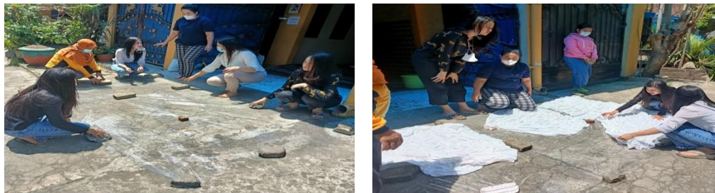
Gambar 6. Persiapan Pewarnaan

Warna warna dasar ini dapat dicampur untuk menghasilkan warna lainnya yaitu warna merah dan biru menjadi ungu; warna kuning dan biru menjadi hijau; warna merah dan kuning menjadi orange dan lainnya, sebagaimana seperti dibawah ini.