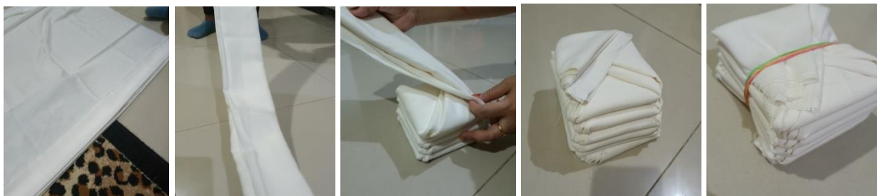
Gambar 3. Membuat Pola Dengan Melipat

Gambar 3 diatas adalah pembuatan pola dengan menggunakan cara melipat berulang kali kain putih yang akan diberi corak jumputan. Cara pelipatannya yaitu bahwa kain yang lebarnya sebesar 2 m tersebut dibentangkan kemudian dilipat bolak balik dengan lebar sekitar 10 cm. Selanjutnya kain yang dilipat tersebut di lipat menjadi bentuk segitiga dan berlanjut sampai dengan kain tersebut habis. Setelah jadi menjadi tumpukan kain yang telah dilipat untuk memperkuat lipatannya terhadap kain tersebut di ikat oleh karet, dan kain yang telah dilipat siap untuk diberi warna.