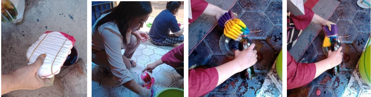
Gambar 8. Proses Pewarnaan 2

menggunakan kuas dilakukan untuk memberikan warna pada ikatan yang sudah ada sebagai corak yang diinginkan.