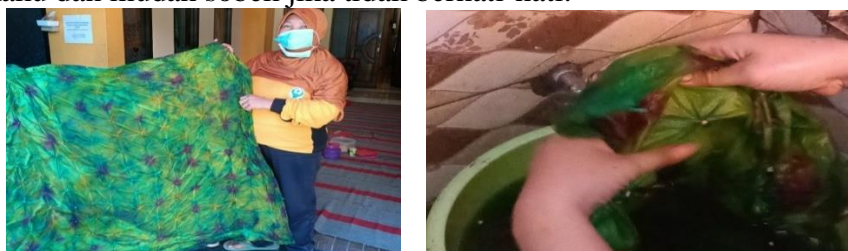
Gambar 10. Peluruhan Water Glass

Pada gambar 9 kain yang sudah diberi warna kemudian masuk pada proses untuk mengikat warna dengan water glass yang fungsinya adalah untuk mengikat warna agar tetap cerah dan juga tidak mudah luntur sehingga akan memberikan corak warna yang indah pada kain. Cara yang digunakan adalah dengan mencelupkan kain yang sudah kering ke dalam ember yang berisi water glass, lalu peras pelan-pelan agar warna tidak bercampur dengan warna lainnya. Kemudian kain-kain tersebut dijemur kembali dengan cara diangin-anginkan. Tidak perlu terlalu lama karena jika terlalu lama dan langsung terkena sinar matahari akan membuat kain menjadi kaku dan mudah sobek jika tidak berhati-hati.