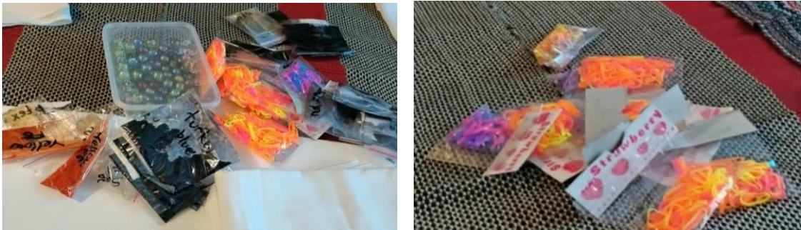
Gambar 1. Peralatan dan Warna Dasar

Setelah pemberian materi mengenai dasar-dasar membuat batik jumputan dan juga tata cara pewarnaannya, kegiatan dilanjutkan dengan praktek secara langsung oleh peserta pelatihan yang diawali dengan dibaginya kain putih selebar 2 (dua) meter yang dijadikan bahan dasar pembuatan kain batik jumputan dan juga dipersiapkan peralatan yang akan digunakan dalam membuat motif jumputan pada kain. Masing-masing peserta sebanyak 8 (delapan) orang mendapatkan satu kain putih.