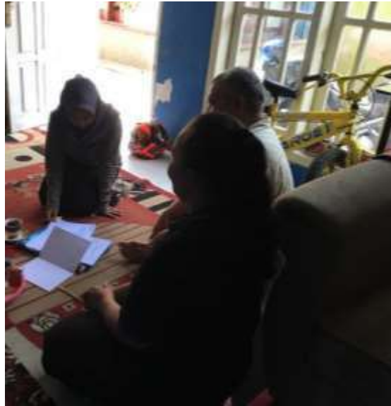
Gambar 4. Pelatihan Pemasaran dan Laporan Keuangan