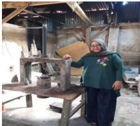
Gambar 3. Peralatan yang digunakan dalam membuat kue kering