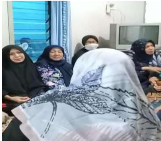
Gambar 2. Koordinasi dengan UKM