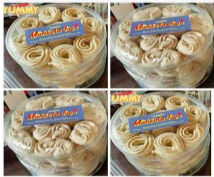
Gambar 1. Produksi Kue Kering Berbahan Dasar Kentang

pengusaha, maka prioritas utama dari permasalahan yang akan diselesaikan adalah sebagai berikut: (1) Dalam hal Produksi. Pengusaha membutuhkan beberapa peralatan yang dapat membantu dalam proses produksi agar lebih cepat dan efisien sehingga dapat memenuhi permintaan dari konsumen. Adapun peralatan yang dibutuhkan antara lain: Peralatan yang digunakan masih kurang mendukung seperti mixer untuk mengaduk adonan kue agar lebih cepat. Diharapkan dengan tersedianya alat tersebut dapat meningkatkan kapasitas produksi kue kering semprit berbahan dasar kentang. (2) Dalam hal manajemen (a) Manajemen Pemasaran. Agar produknya dapat diketahui atau dikenal oleh masyarakat luas maka dilakukan dengan memperoleh materi pelatihan tentang strategi pemasaran yang tepat bagi UKM. Diharapkan dengan memperoleh materi ini maka pengusaha dapat mengembangkan strategi pemasaran sehingga dapat melakukan pemasaran ke berbagai tempat dan seluruh wilayah Jawa Timur dan sekitarnya. (b) Pelatihan laporan keuangan bagi UKM. Dengan diberikan pelatihan tentang laporan keuangan ini diharapkan pengusaha dapat membedakan sumber keuangan yang digunakan untuk pribadi dan yang digunakan untuk kegiatan mengembangkan usaha, sehingga pengusaha dapat membedakan keuangan usaha dan rumah tangga.